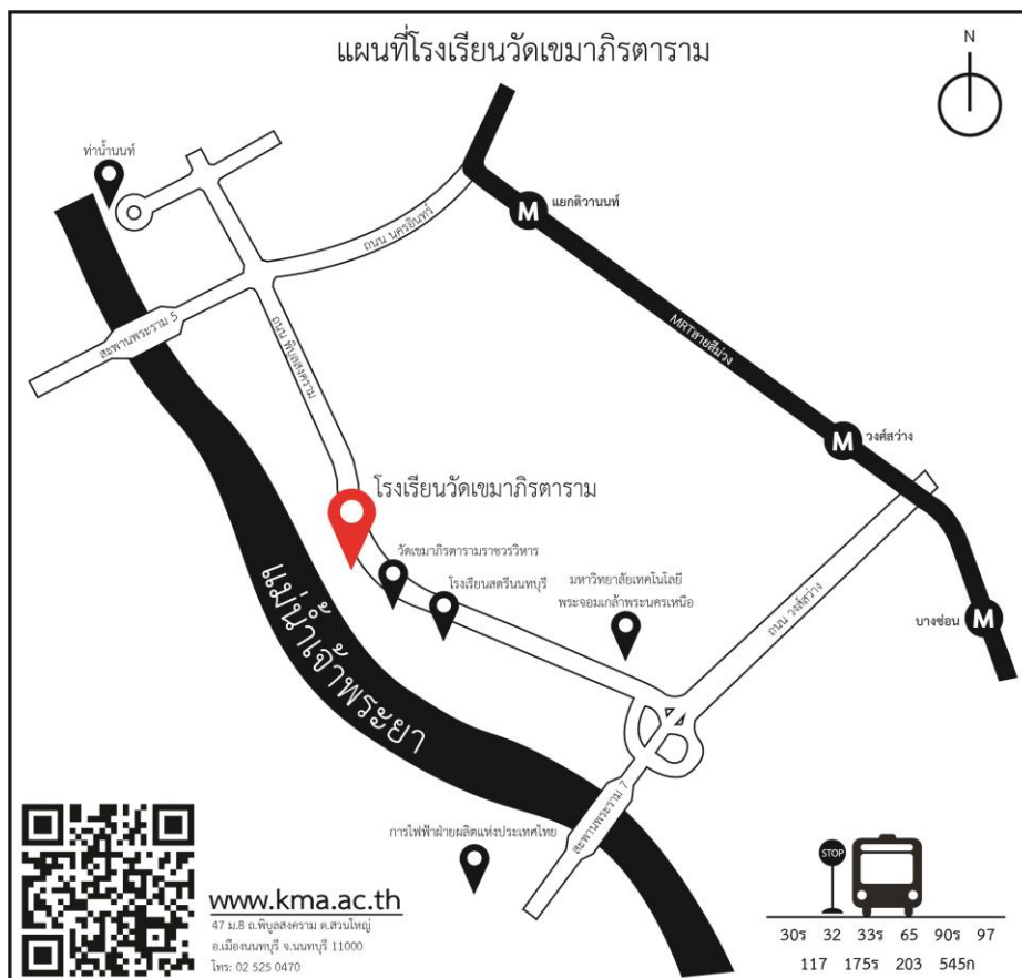
ภาพที่ ๑ แผนที่โรงเรียนวัดเขมาภิรตาราม

ชื่อโรงเรียนวัดเขมาภิรตาราม ที่ตั้ง ๔๗ หมู่ ๘ ตำบลสวนใหญ่ อำเภอเมืองนนทบุรี จังหวัดนนทบุรี สังกัดสำนักงานเขตพื้นที่การศึกษามัธยมศึกษา เขต ๓ โทร.๐๒-๕๒๕-๐๔๗๐ โทรสาร ๐๒-๕๖๖-๕๙๘๙ e-mail:khemapirataram@hotmail.com website :http://www.kma.ac.th เปิดสอนระดับชั้นมัธยมศึกษาปีที่ ๑ ถึงระดับชั้นมัธยมศึกษาปีที่ ๖ เนื้อที่ ๑๖ ไร่ ๒ งาน ๖๖ ตารางวา เขตพื้นที่บริการ ได้แก่ เขตอำเภอ เมืองนนทบุรี ซึ่งประกอบด้วยตำบลสวนใหญ่ ตำบลบางเขน ตำบลตลาดขวัญ ตำบลบางไผ่ ตำบลบางศรีเมือง ตำบลบางกระสอ เขตพื้นที่กรุงเทพมหานคร ได้แก่ เขตบางซื่อ (แขวงวงศ์สว่าง แขวงบางซื่อ) เขตบางพลัด (แขวงบางอ้อ)